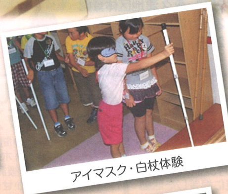
アイマスク・白杖体験