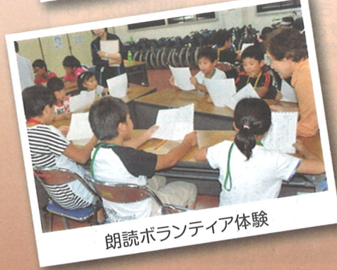
朗読ボランティア体験