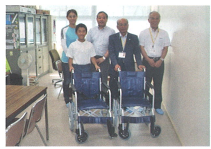
南小学校PTAで取り組んでいるプラタフ収集活動により交換した2台の車椅子を当協議会へ寄贈いただきました。

介護用ベッド、車椅子、エアーマット、スロープ、シャワーチェア、昇降椅子等の福祉用具を購入し無料で貸出しています。