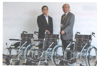
小林市民生委員児童委員協議会様より車椅子を福祉事業のために寄付いただきました。