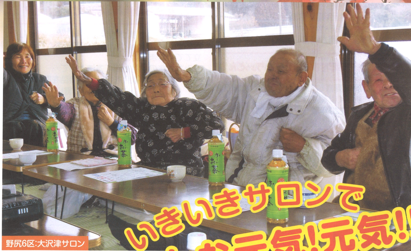
野尻6区:大沢津サロン