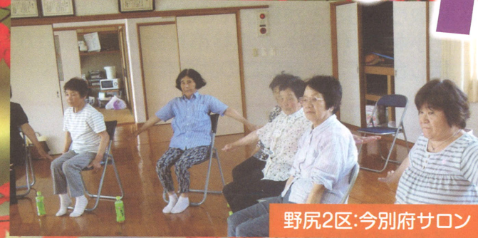
野尻2区:今別府サロン