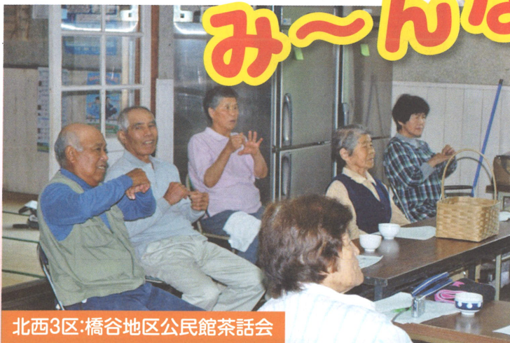
北西3区:橋谷地区公民館茶話会