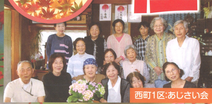
西町1区:あじさい会