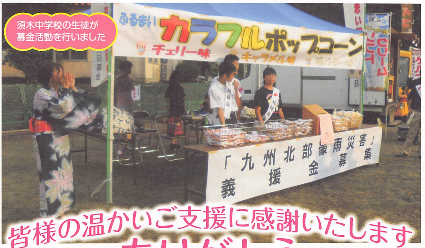
須木中学校の生徒が 募金活動を行いました