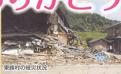
東峰村の被災状況

平成29年7月九州北部豪雨により被災された皆様に、心よりお見舞い申し上げます。本市社会福祉協議会でも義援金受付ならびにボランティアセンターへ職員派遣をしております。九州北部豪雨義援金には多くの団体、個人の皆様に寄託していただいており、温かいご支援に心から感謝いたします。