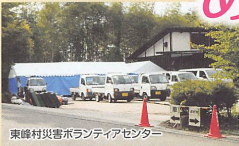
東峰村災害ボランティアセンター