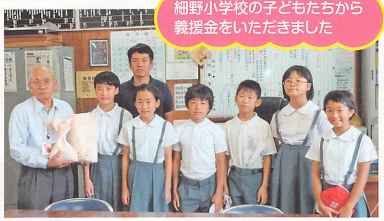
細野小学校の子どもたちから 義援金をいただきました

平成29年7月九州北部豪雨により被災された皆様に、心よりお見舞い申し上げます。本市社会福祉協議会でも義援金受付ならびにボランティアセンターへ職員派遣をしております。九州北部豪雨義援金には多くの団体、個人の皆様に寄託していただいており、温かいご支援に心から感謝いたします。